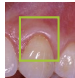
8 Monate nach der Behandlung mit Straumann® Emdogain® Zahnhals völlig bedeckt